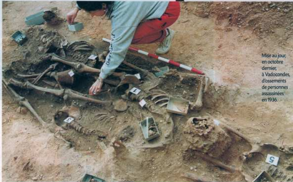
Mise au jour, en octobre dernier, à Vadocondes, d'ossements de personnes assassinées en 1936.