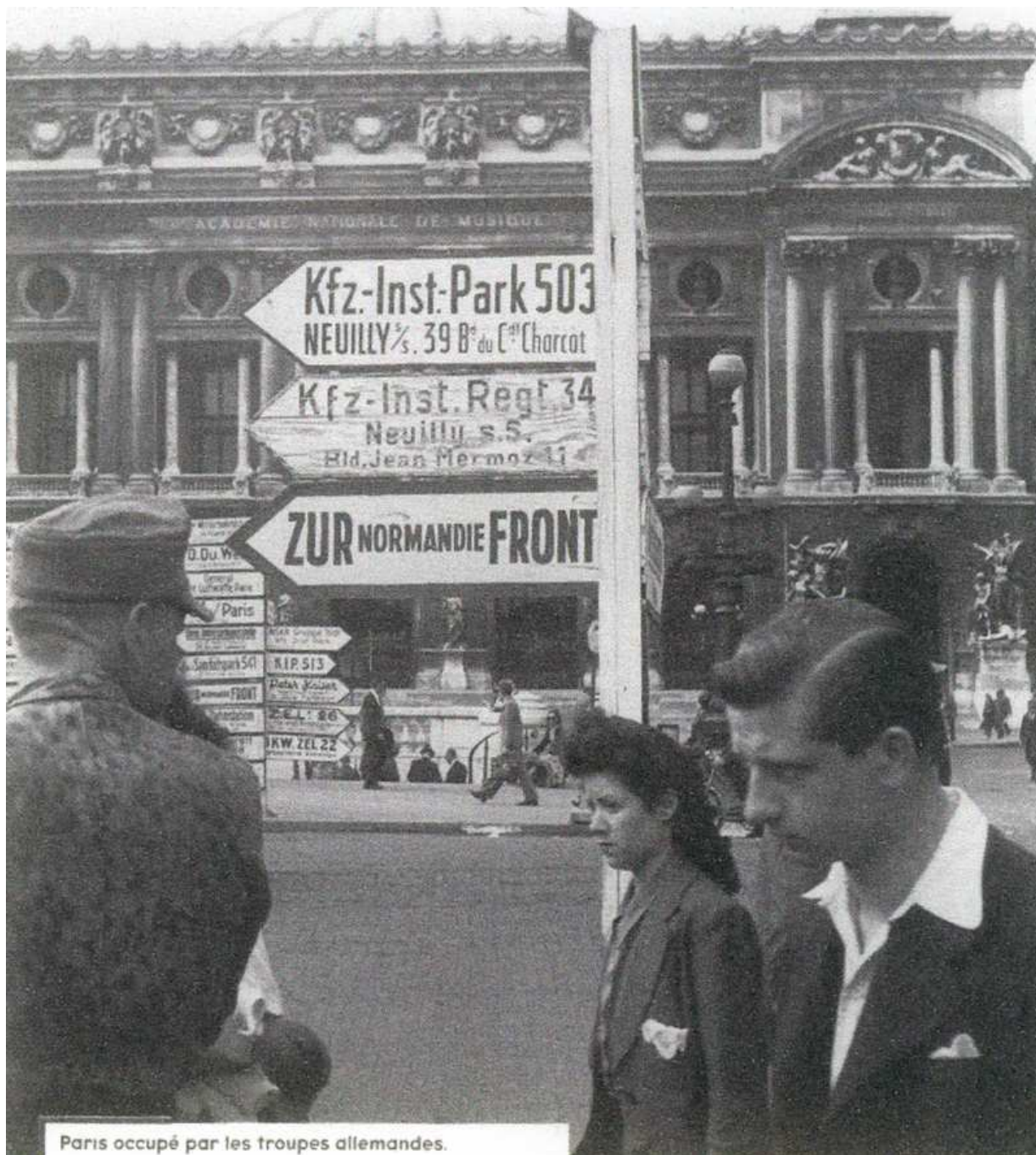
Paris occupé par les troupes allemandes.